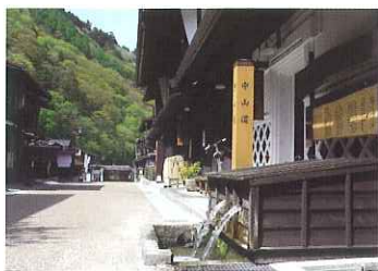
江戸時代の懐かしい町並み「上の段」