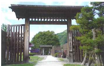
日本四大関所の一つ「福島関所跡」