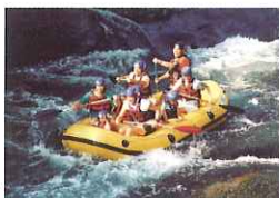
木曽川を豪快に下るラフティング